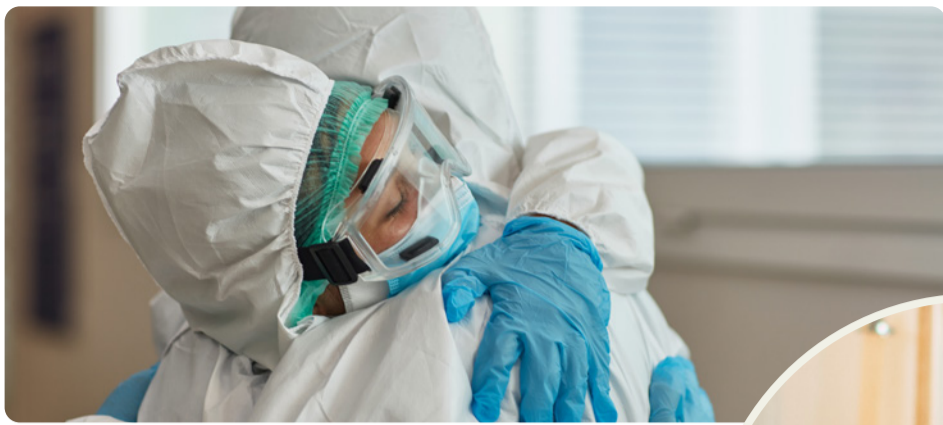
Pandemin visade på brister i välfärden. Vänsterpartiet vill bygga samhället starkt igen.

att välfärden ska bli sämre hela tiden, det beror helt på politiska beslut. Vi måste ta tillbaka kontrollen över skola, vård, omsorg och infrastruktur. Det fungerar inte att ge mindre och mindre pengar till verksamheter som dessutom ska ge en allt större andel av de pengarna till privata bolagsvinster. Det har slagit sönder välfärden och skapat otrygghet.