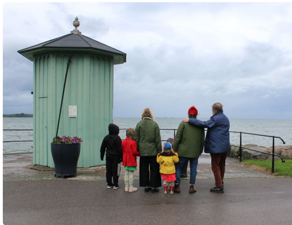
Värna Vättern för våra barns framtid.