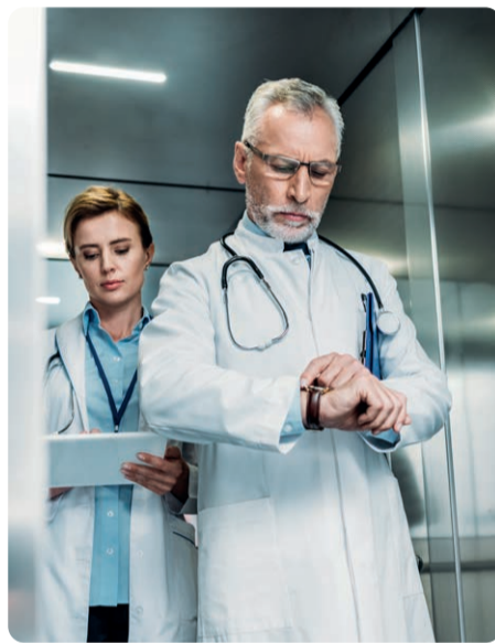
Det är dags att börja tänka på en kortare arbetstid, menar Vänsterpartiet