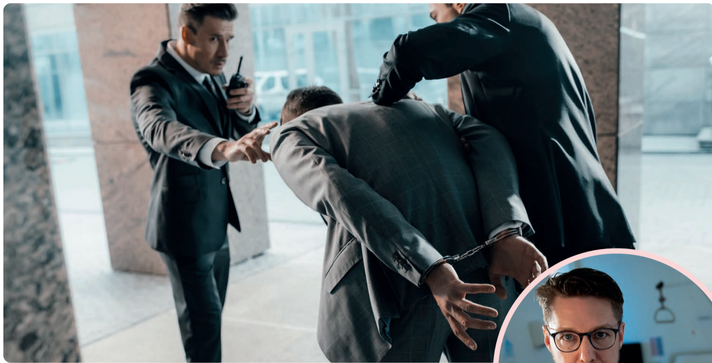
Tydligare kontroller. Vänsterpartiet vill sätta stopp för kriminella företag i välfärden